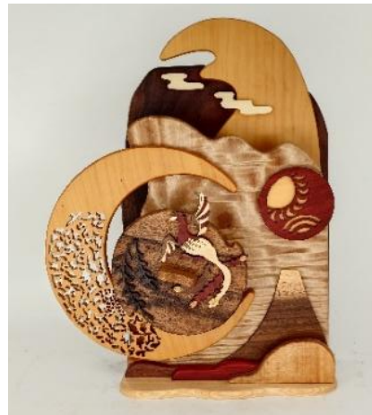
〈本作品展初公開〉 月に想う / 72 弁オルゴール

天然木を使用し、一点一点が手仕上げのオルゴール作品は、ぜんまいを巻くとやさしい音色とともに、木の絵本のような物語の世界が広がります。数年ぶりとなる地元京都での作品展開催となる本展では、京都の銘木である栃や銀杏などの天然木を使用した作品をはじめ、木それぞれが持つ表情や風合いを楽しめる新作・初公開作品を多数ご用意しております。